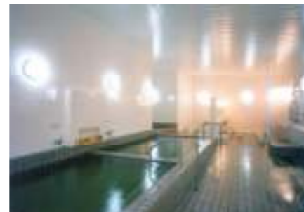
泉質：ナトリウム塩化物泉

横浜温泉チャレンジャー 横浜市旭区上川井町 2287 番地 ☎ (045) 922-5590